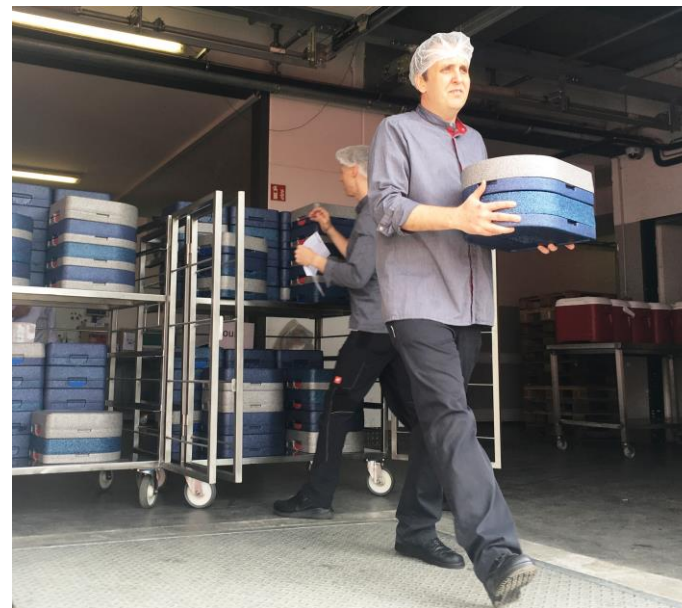
Suppe, Hauptgericht und süßes Dessert – demnächst kommt der Mobile Mittagstisch der NBH komplett aus der Küche der Firma Käfer in Parsdorf