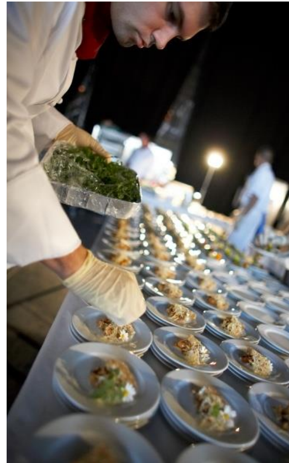
Käfer-Koch bei der Arbeit

und dann online die neuen Käfer-Menüs bestellen . →→→